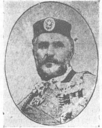
Duque Nicolás I, de Montenegro Padre de la actual reina de Italia

Si el teniente Basiatinski hubiera sido hombre de mas ánimos, habria habido otro matrimonio desigual en la familia del autócrata de todas las Rusias. La hermosa gran duquesa Olga, la hija favorita del czar Nicolás I, estaba a punto de escaparse con el teniente, cuando en el último mo-