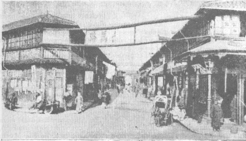
TIEN-TSIN, teatro de las matanzas de europeos

El heredero del duque Alfredo es su hijo Al-