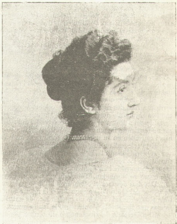
S. M. Elena de Montenegro ACTUAL REINA DE ITALIA