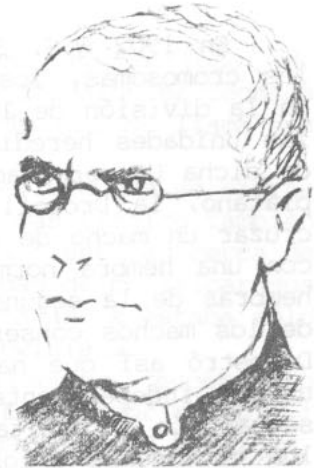
Juan G. Mendel.

La primera base científica de la hoy poderosa Ciencia Genética que está transformando la biología en el descubrimiento más modificador de la vida mineral, vegetal y animal, fué presentada por un fraile agustino, Juan Gregorio Mendel, a la sociedad Científica de Brunn, en la vieja Checoslovaquia, en una helada noche del 8 de Febrero de 1865, repitiéndola un mes después, en lo que al final fué condensado en una monografía titulada sencillamente :