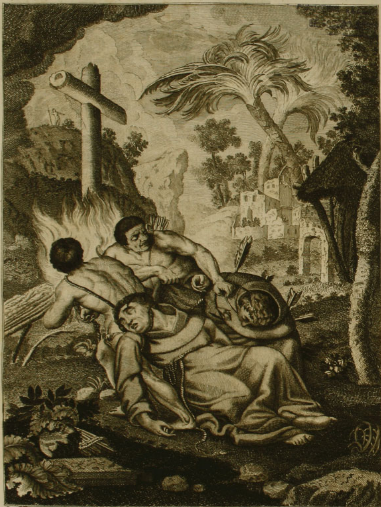
St. James inu.