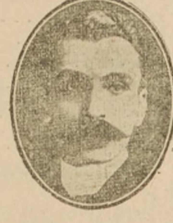
Don Alfredo Baquerise Moreno, Presidente del Ecuador.