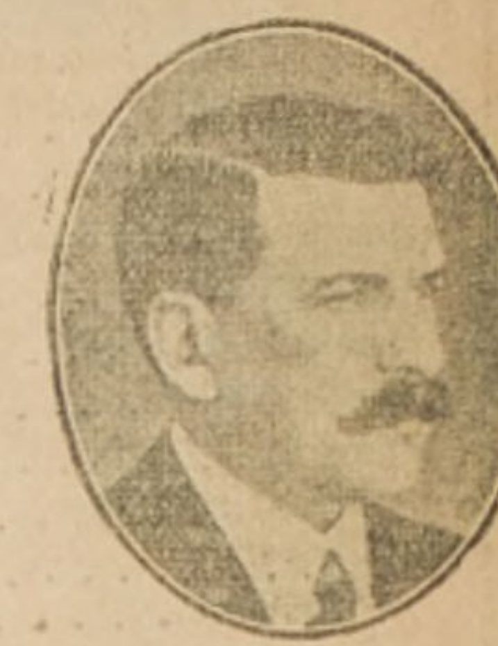
Dr. Wenceslao Braz, Presidente de Brasil, en guerra con Alemania desde el 26 de Octubre.