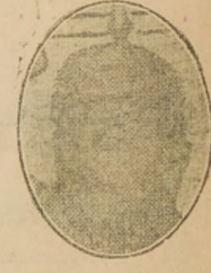
Conde Von Luxburg, Ministro de Alemania en Buenos Aires.