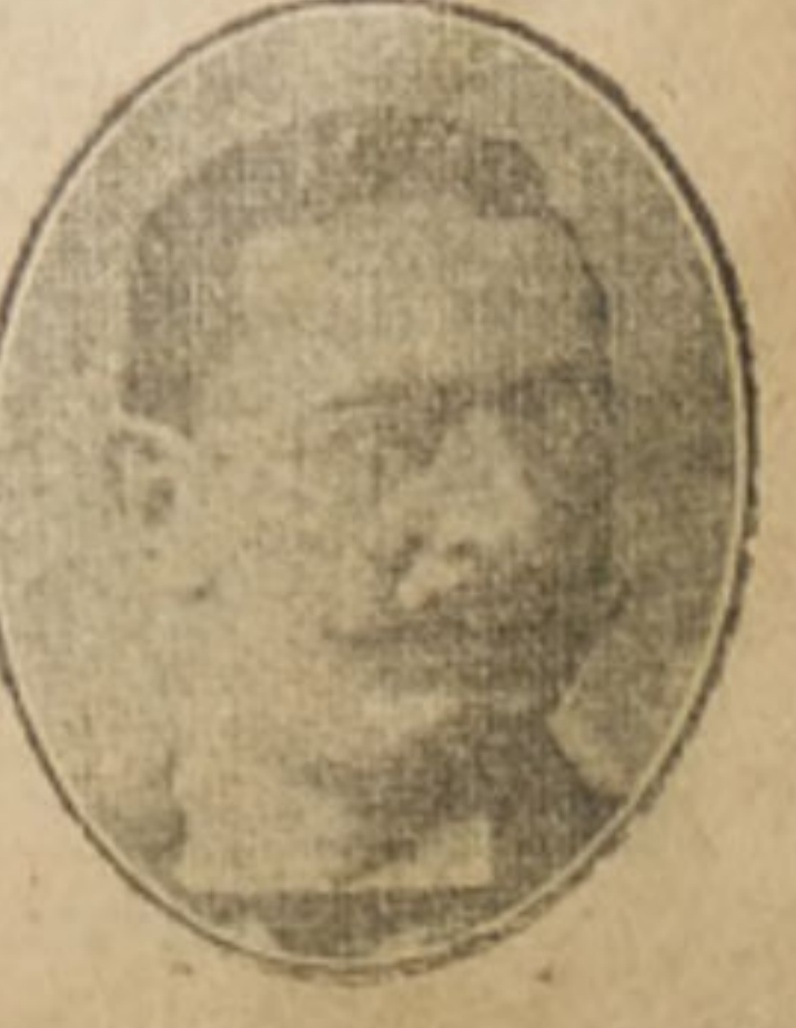
Sr. Manuel Garcia Prieto, actual premier.