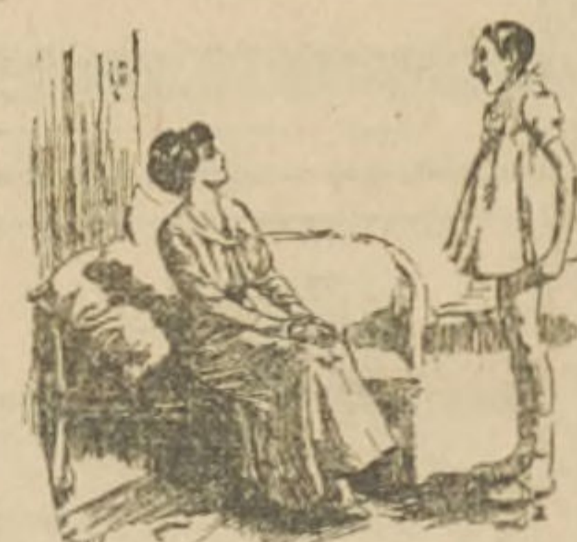
Una mujer tiene los años que representa. En cambio, un hombre tiene los años que siente.

útiles propios no son usados por nadie más. Y al acudir tanto a los servicios de pedicuros y manicuras, las damas norteamericanas nos hacen volver a los más viejos tiempos, a la época anterior al establecimiento del cristianismo. En efecto, las damas romanas del imperio tenían especial predilección por sus manos y por sus pies, tanto más cuanto éstos los llevaban casi del todo descubiertos, como se sabe.