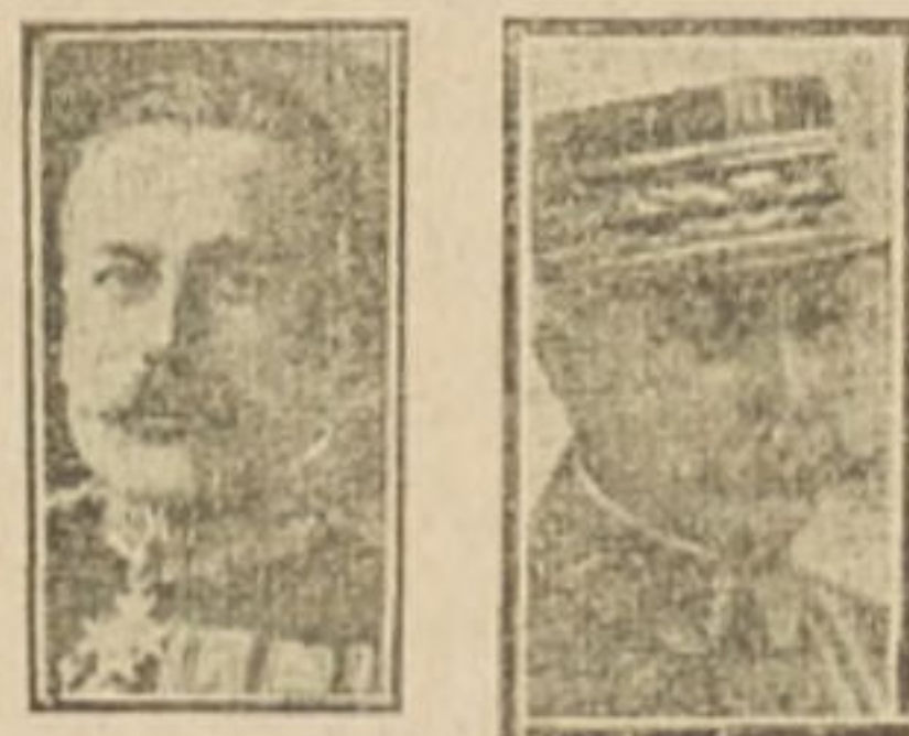
Sir Douglas Haig General Petain