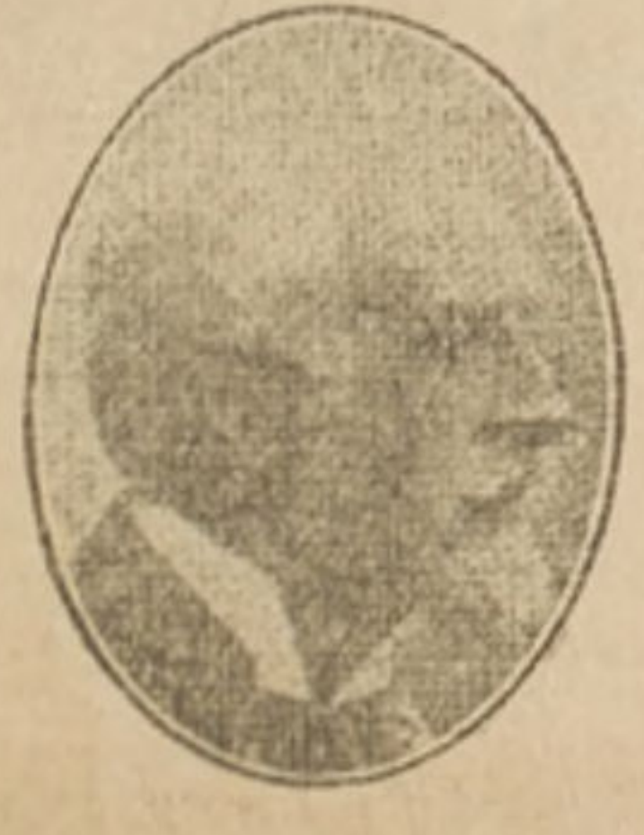
Gumersindo de Azcarate