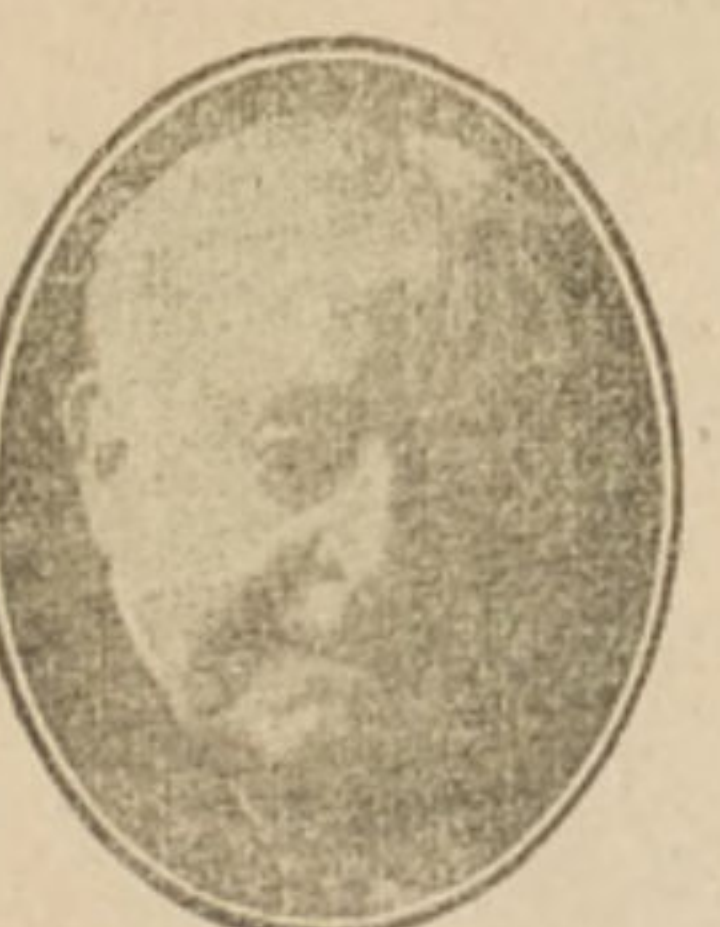
Mr. Joseph H. Choate.