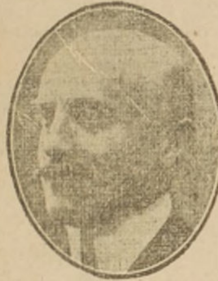
M. Joseph Caillaux.