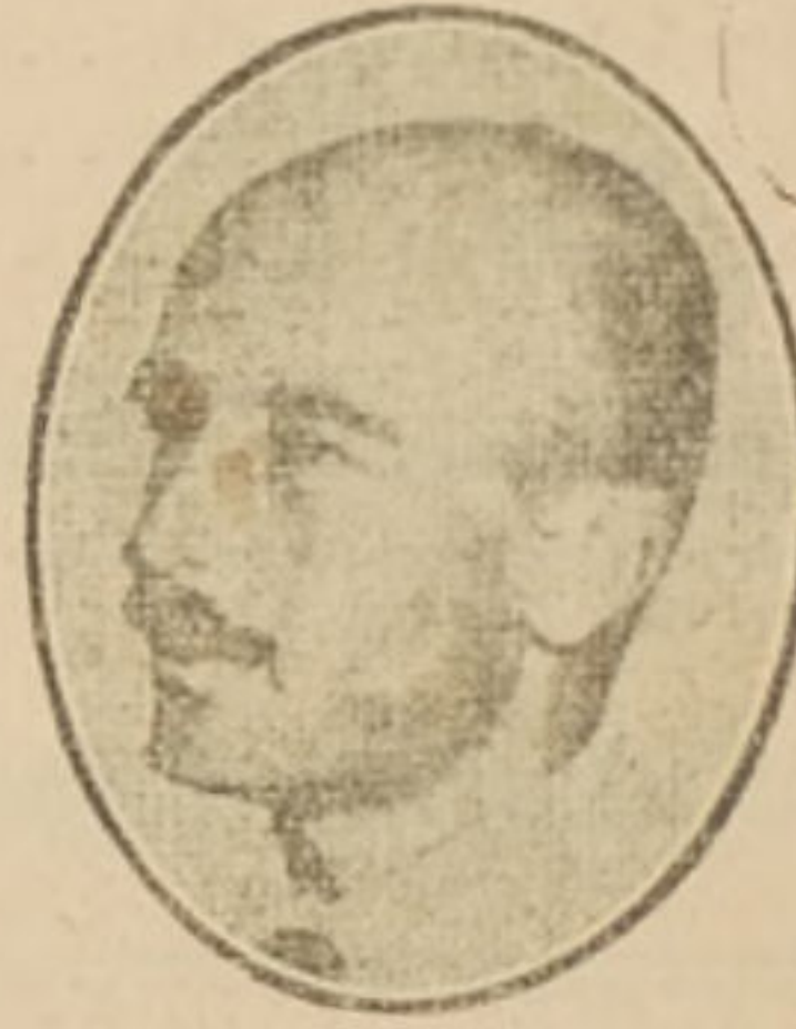
Herr Jorge Michaelis, que sucedió a Hollweg.