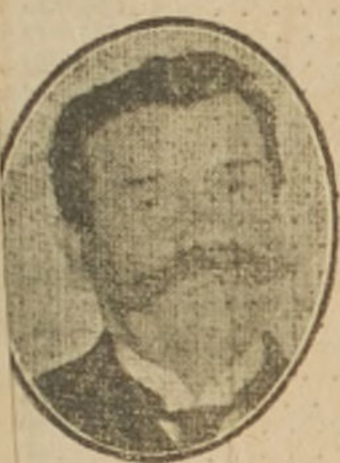
Don Manuel Montes, Presidente de Bolivia, que rompió relaciones con Alemania el 13 de Abril.