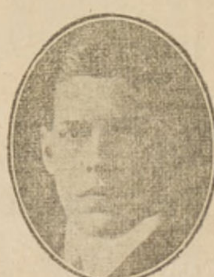
Alejandro I, Rey de Grecia.