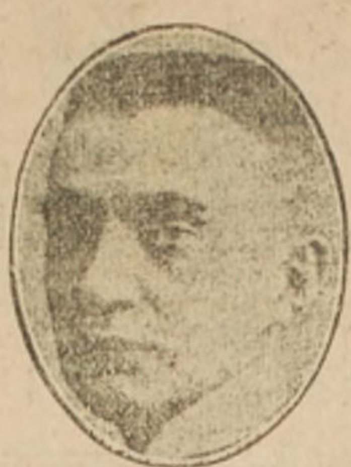
Alejandro Keronsky, sucesor del Príncipe Lvoff y derrocado el 8 de Noviembre.