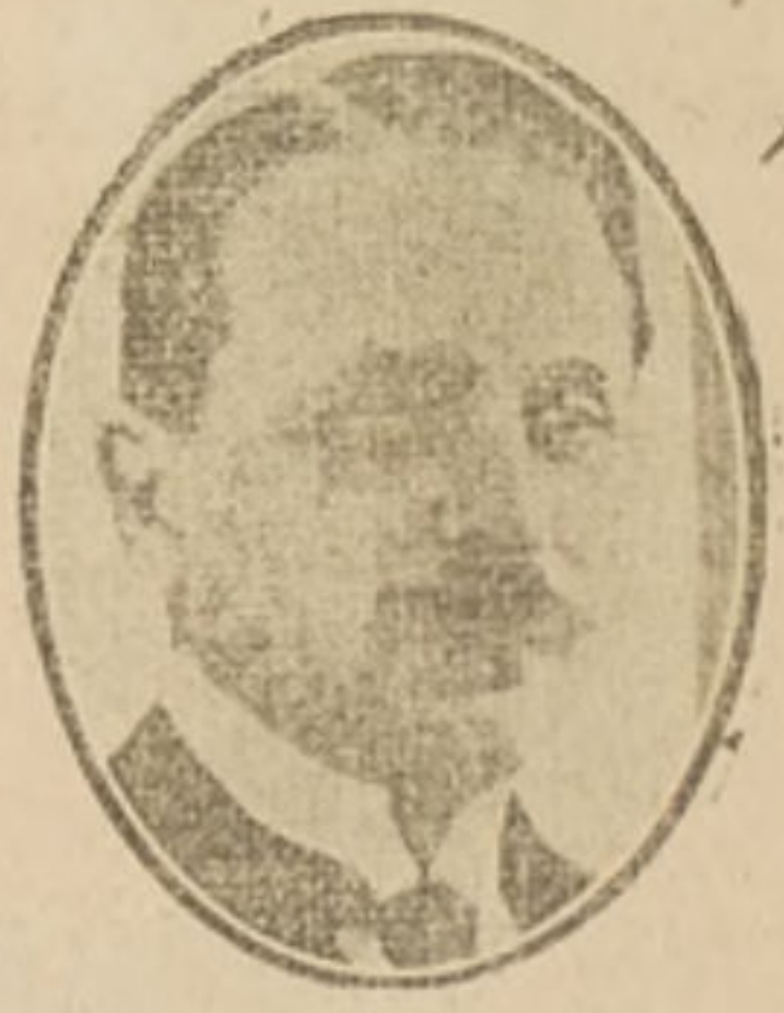
Don Honorio Pueyrredon, Ministro de R. de Argentina.