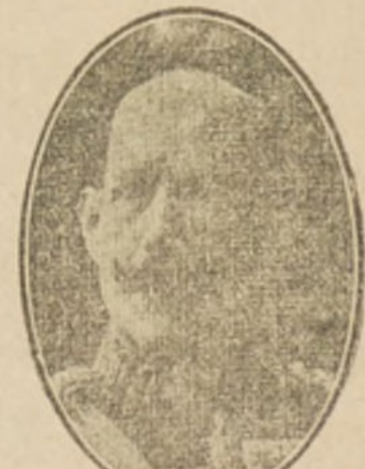
Constantino I, abdicó el 12 de Junio.