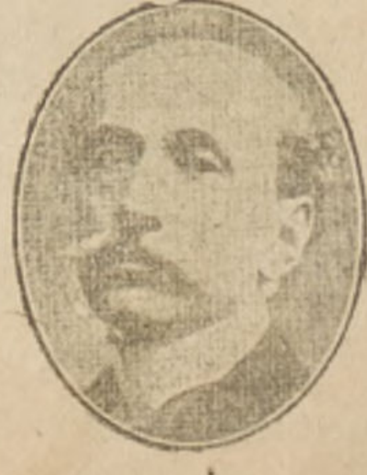
Don Eduardo Dato, sucesor de Sr. Manuel Garcia Prieto, actual premier.