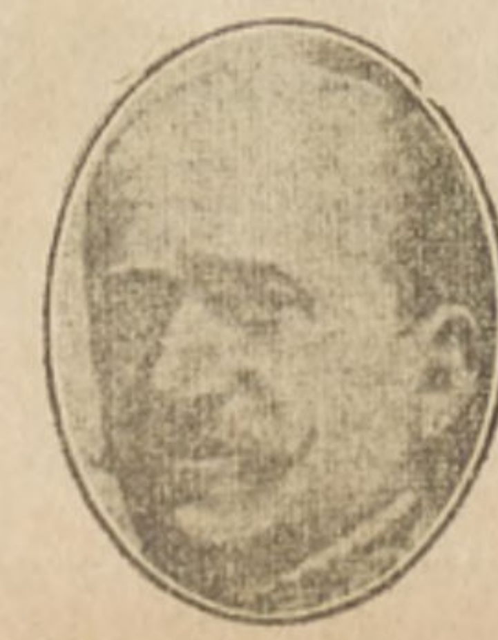
Conde de Romanones.