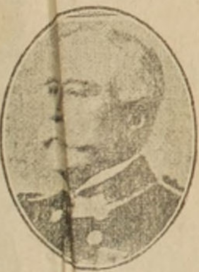
Almirante Jorge Dewey.