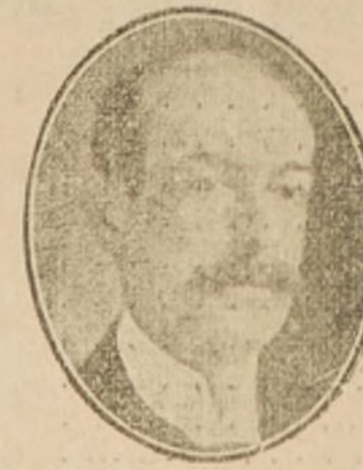
Don Manuel Valdes, Presidente de Panamá, que siguió a Cuba en su guerra con Alemania desde el 26 de Octubre.