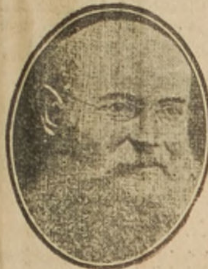
Príncipe Pedro Kropotkin, llamado Máximo Gorki, famoso escritor revolucionario.