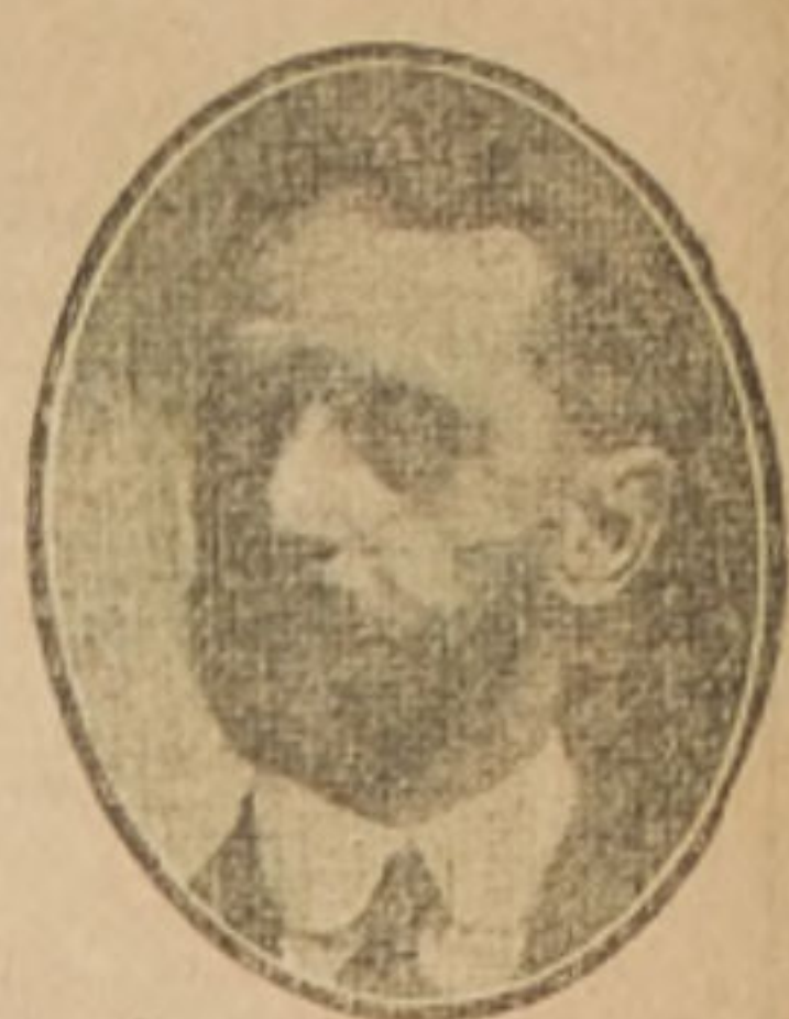
Don Mario C. Menocal, Presidente de Cuba, en guerra desde el 6 de Abril.