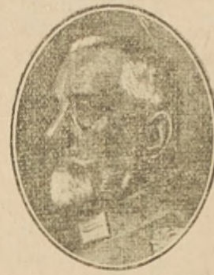
Von Bethmann Hollweg, Canciller Imperial, Dimitió el 14 de Julio.