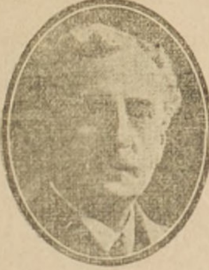
Mayor W. H. K. Redmond.