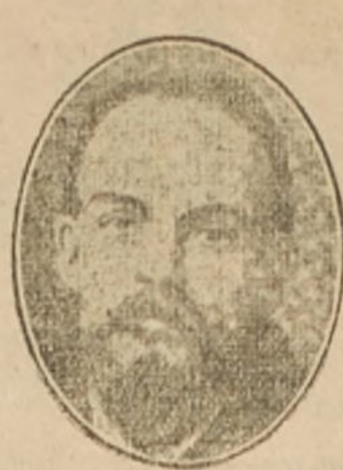
Nicolás Lenin, Jefe de los maximalistas y actual jefe del Gobierno.