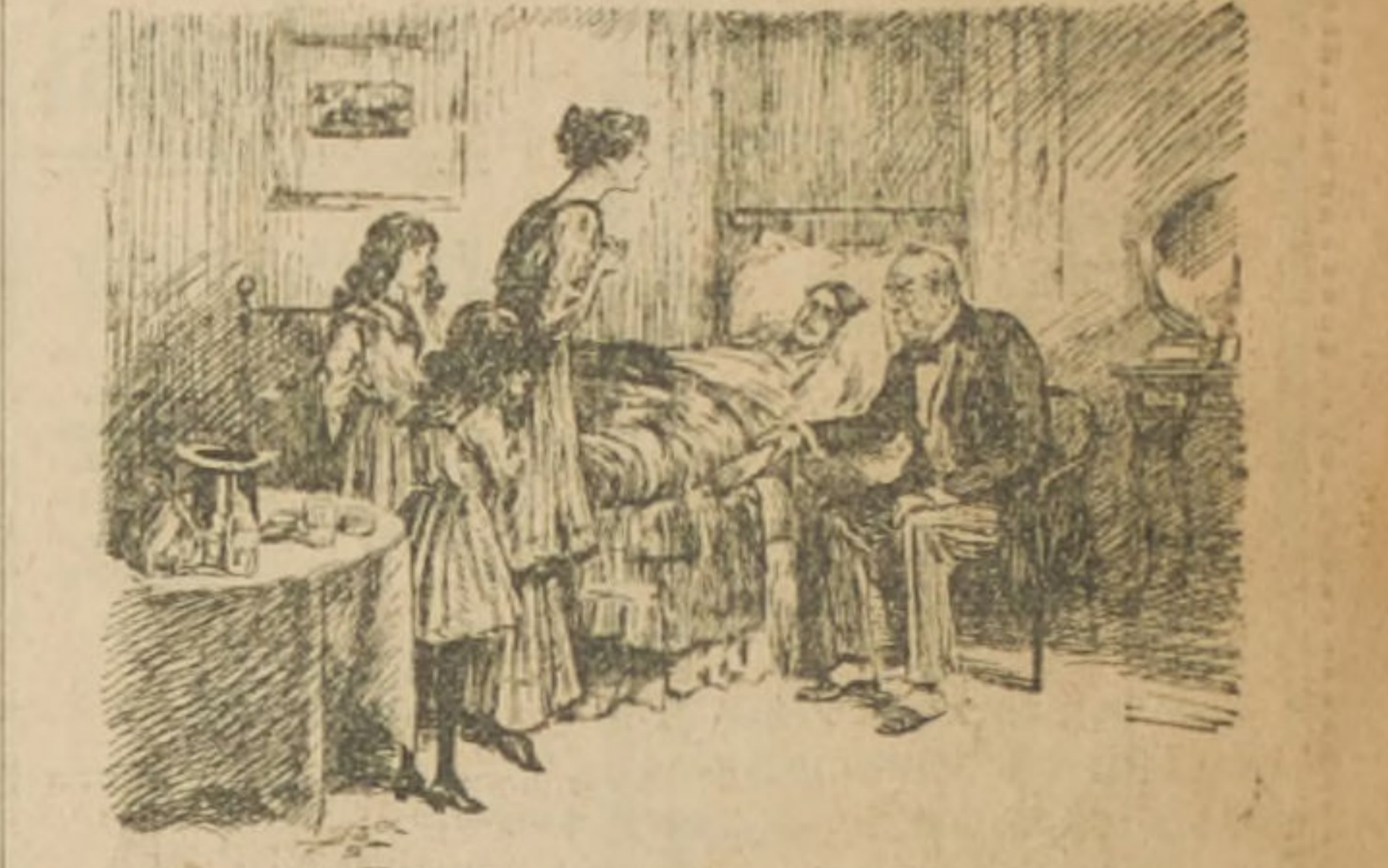
"¿Qué pasa doctor? No me oculta la situación del enfermo." "Es que por más que hago, no encuentro un sólo síntoma de enfermedad. Y estoy seguro de que debo estar equivocado."