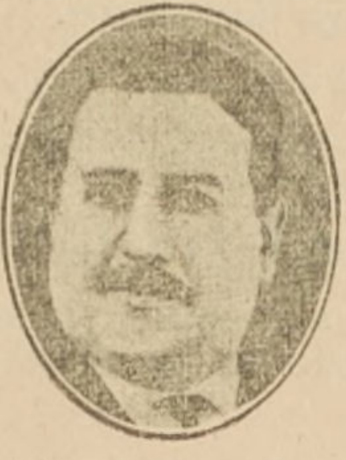
Don Feliciano Viera, Presidente del Uruguay.