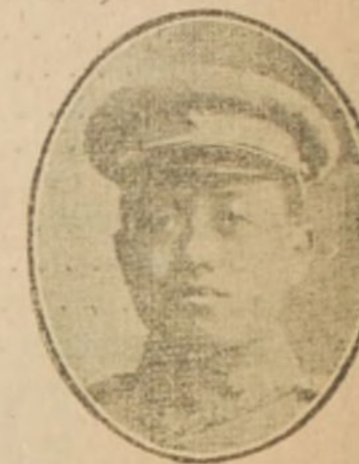
Ch. Maha Vajiravudh, Rey de Siam, en guerra con Alemania.