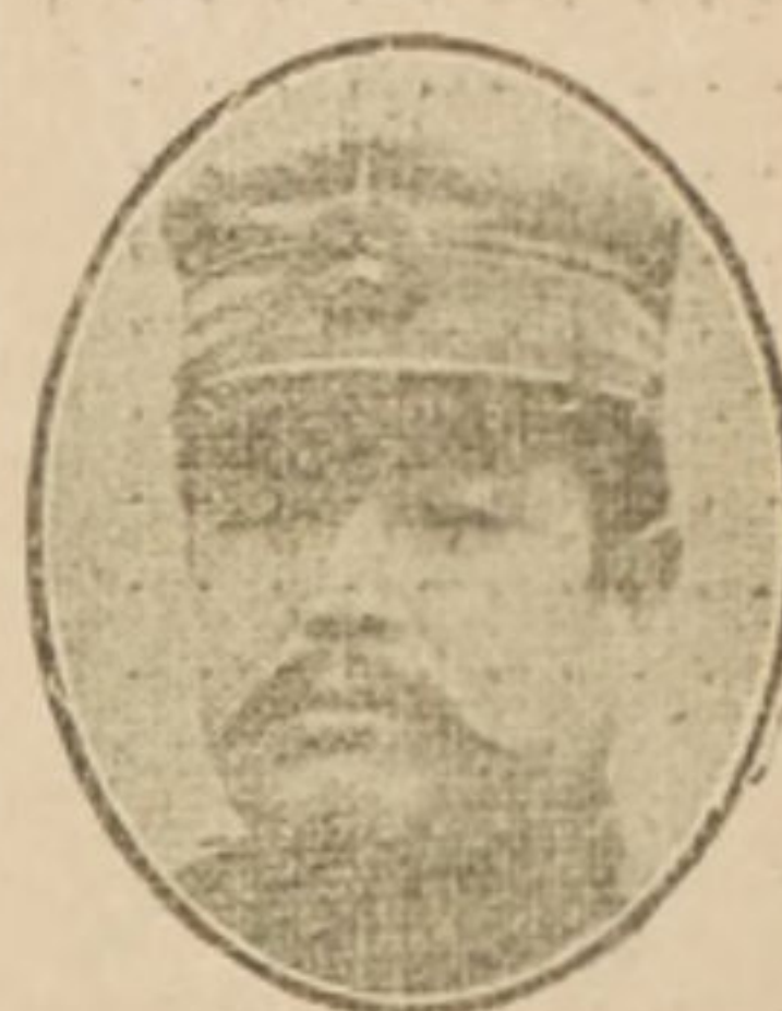
Li-Yuen-Hung, Presidente de China, en guerra con los Imperios Centrales desde el 14 de Agosto.