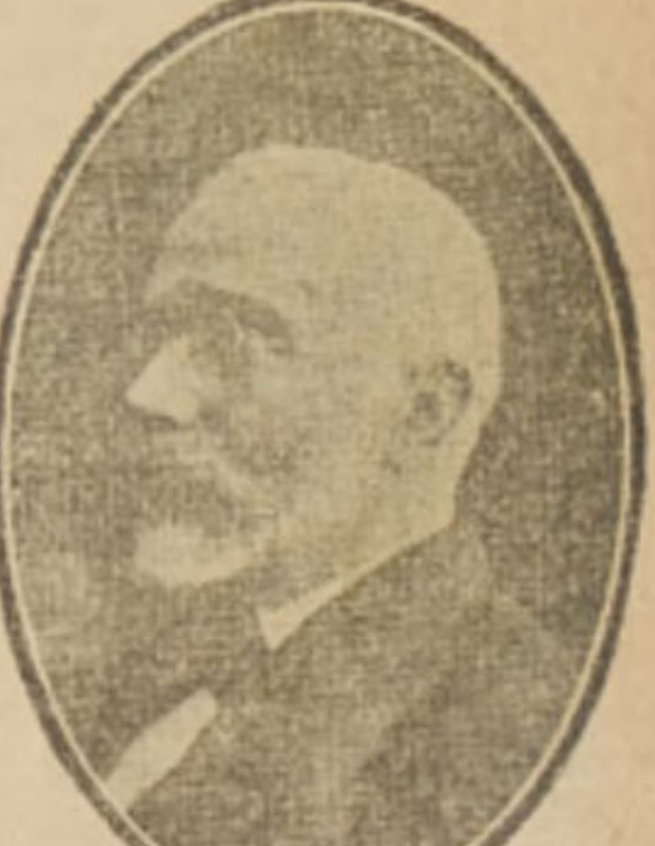
Sr. Venizelos, Premier griego