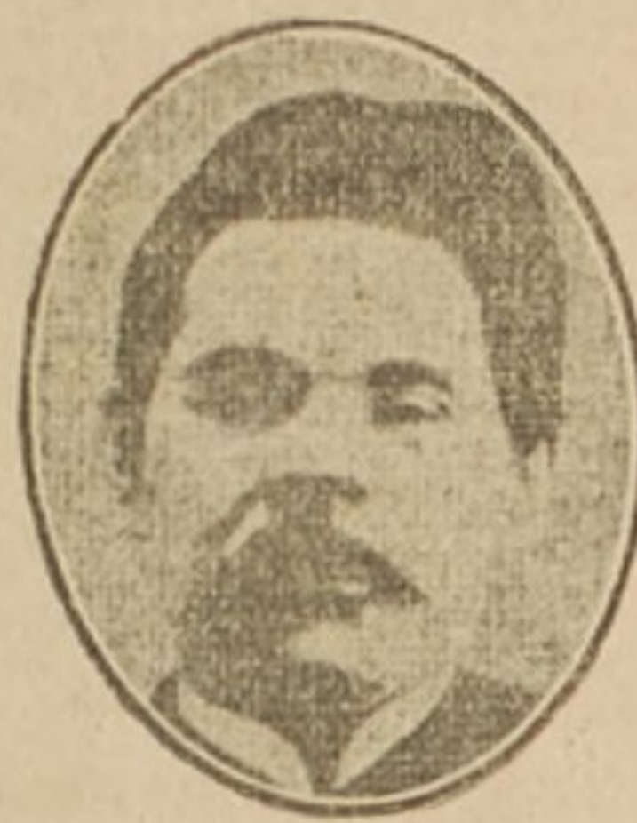
General Laurus Korniloff.