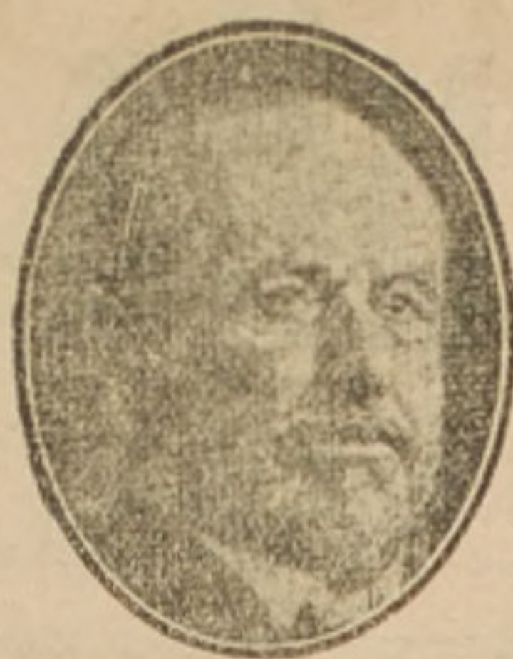
Miguel Rodzianko, Presidente de la Duma.