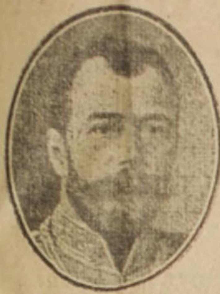
Czar Nicolas II, que abdicó el 15 de Marzo.