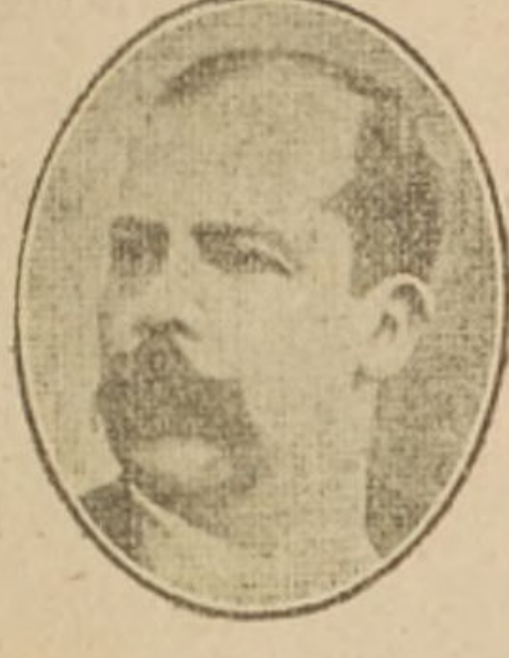
Don Manuel Estrada Cabrera, Presidente de Guatemala, que rompió con Alemania el 28 de Abril.