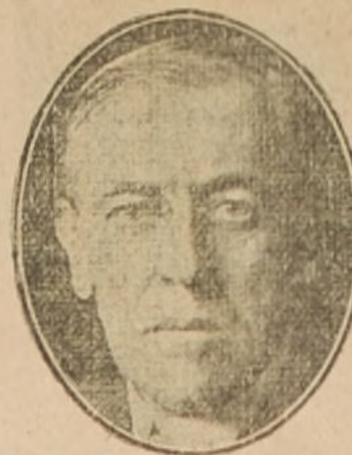
Mr. Woodrow Wilson, Presidente de los Estados Unidos, en guerra con Alemania desde el 4 de Abril.