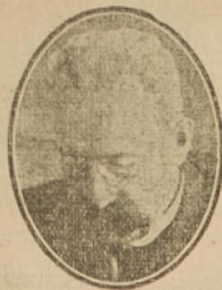
Príncipe Jorge Lvoff, Jefe del Primer Gobierno Provisional.