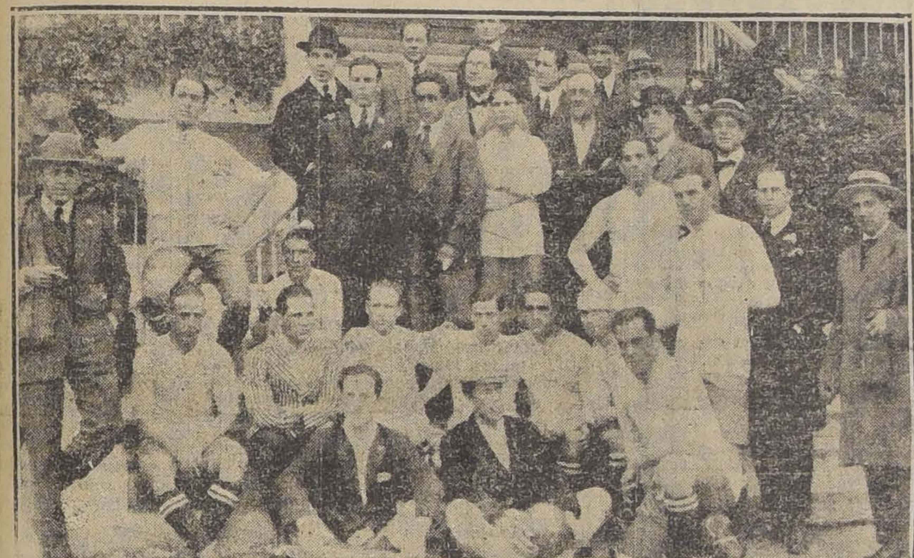
EQUIPO URUGUAYO, VENCEDOR DE LA JORNADA DE AYER Y CAMPEON DEL CONTINENTE

Los ansiosos, el entusiasmo de aquella masa compacta de espectadores, serán perdurable aliento del esfuerzo desplegado por el equipo nacional, pues su sólo recuerdo servirá de base para que estas sanas y benéficas actividades entren a un nuevo período de amplio y halagüeño horizonte.