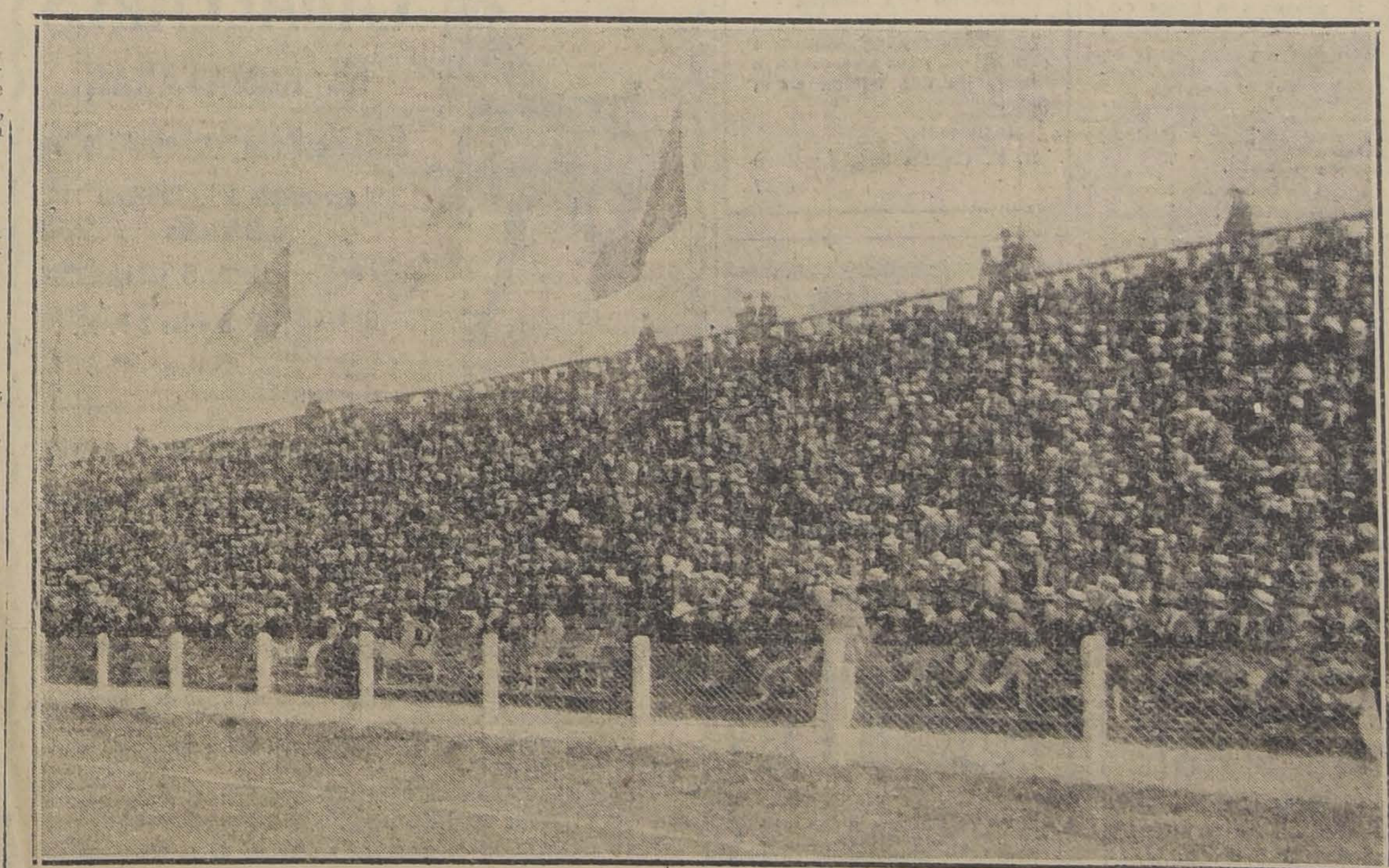
VISTA PARCIAL DE LA CONCURRENCIA