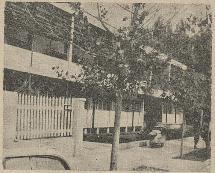
En el flamante edificio ubicado en la calle Los Aromos esquina de Máximo Jeria, una centena de alumnos han depositado sus esperanzas de poder desarrollar una labor que satisfaga sus inquietudes e ideales para un mundo mejor. ¿Se verán ellas frustradas con los nuevos planes que han provocado controversias? Este y otros problemas se abordan en la presente crónica del redactor de CLARIDAD, Darío Poblete.