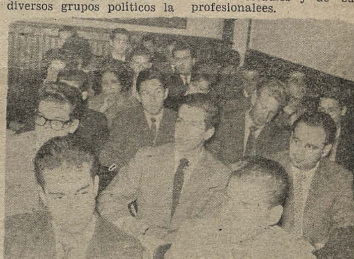
Uno de los cursos semestrales, en clases.

de este proyecto, que resolvería completamente el problema habitacional de los estudiantes de provincia y de la capital. Por último, también cristalizó este año, la idea largamente acariciada de contactar con una cooperativa de consumo, destinada a que los universitarios de Santiago, por intermedio de la Federación máxima estudiantil, UFUCH, pudieran adquirir sus elementos de trabajo, a precios más convenientes que en el comercio, junto con participar en una acción común de positivo interés y de integración 1° teruniversitaria. Esta cooperativa, como era de esperarse, tuvo que vencer varios escollos, en su concretización, es así como abrirá sus puertas, en forma experimental, en el mes de julio, del presente año, esperando que el próximo año, pueda ampliar sus existencias, cubriendo todas las necesidades del alumnado de Santiago.