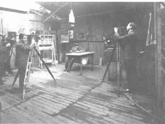
Un "estudio" del cine mudo. Este, un tanto tétrico, pertenecía a Esteban Artuffo. Él tomó la foto; por lo tanto, no aparece en ella. Si alguien reconoce a quienes aparecen en la foto, rogamos escribirnos dándonos los datos. Nosotros, por lo demás, ante la cantidad de cámaras que enfocan al señor que lee el diario, se nos ocurre que estaban tratando de crear lo que ahora se conoce como Cinerama...